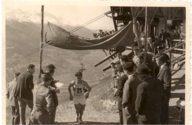
Latsch - St.Martin 50Min 2Sek