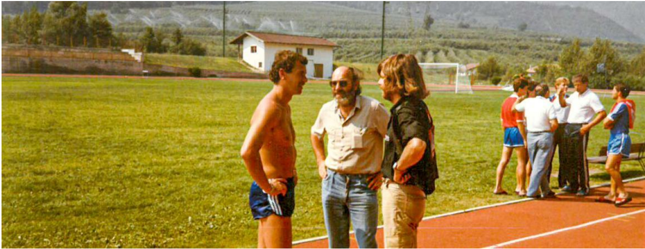
Jürgen Hingsten 1982 Vorbereitung Olympische Spiele in Los Angeles