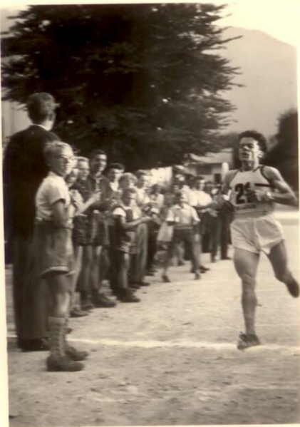
Dorfrennen Latsch 1954