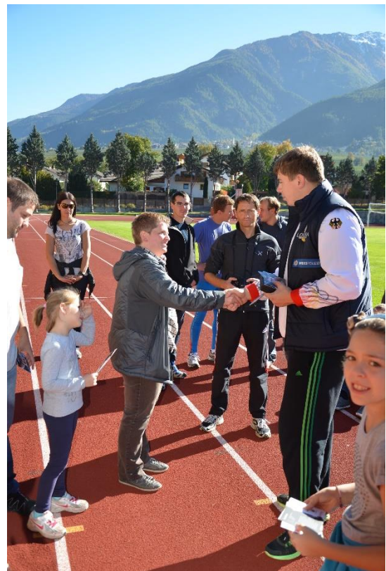
David Storl Vorbereitung Olympische Spiele 2012 in London