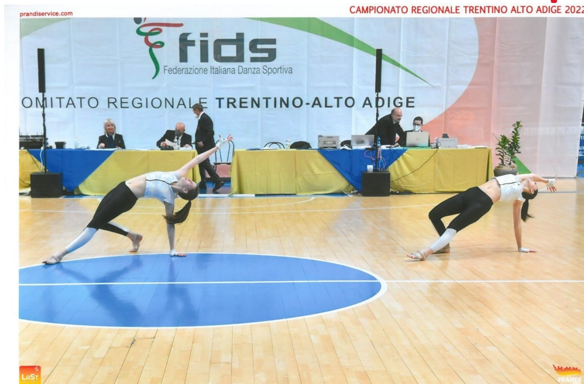
10 APRILE - RIVA DEL GARDA (TN)