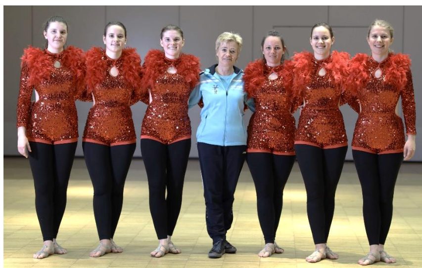
Im Bild: die Wettkampfgruppe Over 16