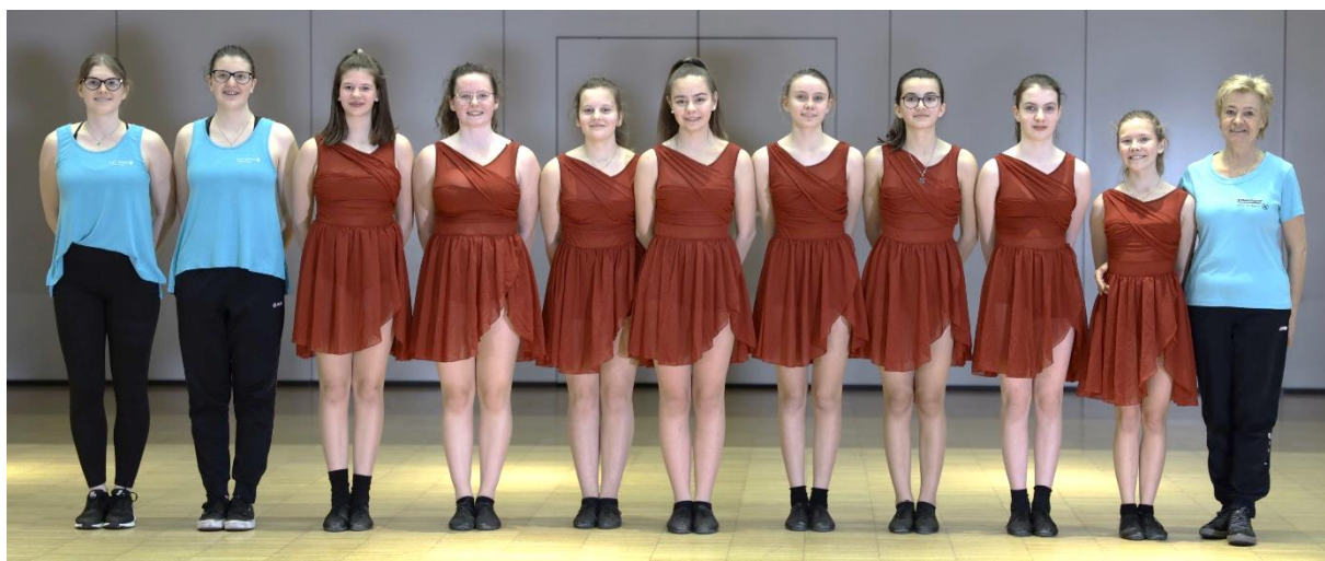
Im Bild: die Wettkampfgruppe Under 15