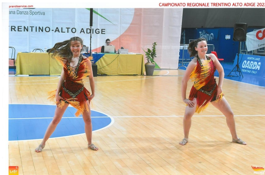
10 APRILE - RIVA DEL GARDA (TN)