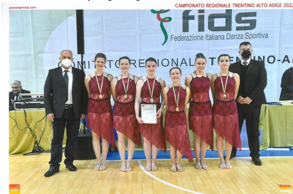
10 APRILE - RIVA DEL GARDA (TN)