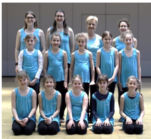
Im Bild: Die Hobbygruppe mit Mädchen im Alter von 8 – 15 Jahren