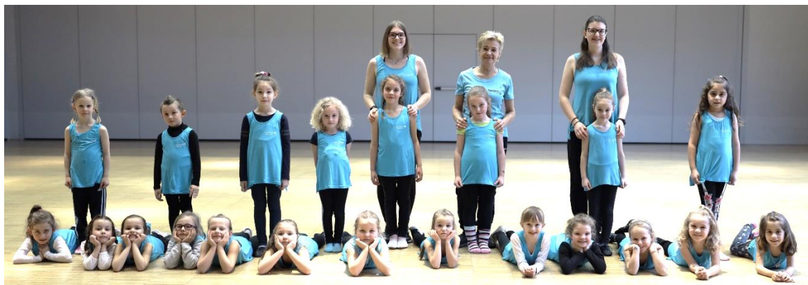
Im Bild: Die Hobbygruppe mit Mädchen im Alter von 5 – 7 Jahren