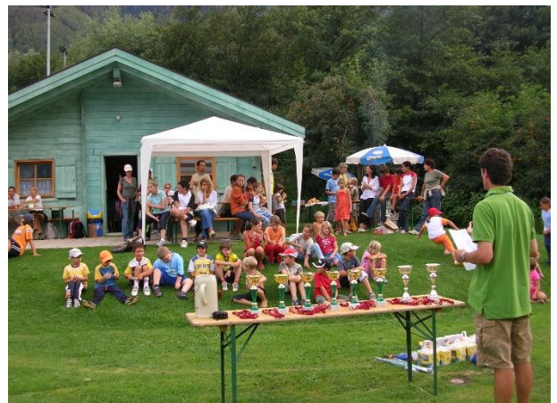
VSS Turnier 2006