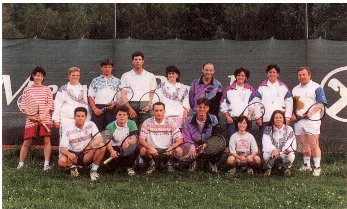
Damen - und Herrmannschaft 1995