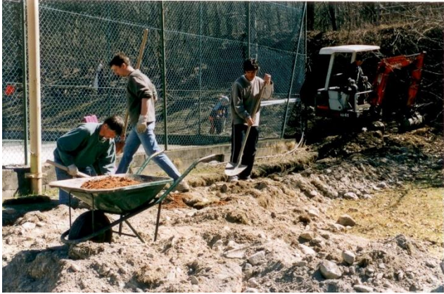
Grabarbeiten bei den Tennisplätzen 2003