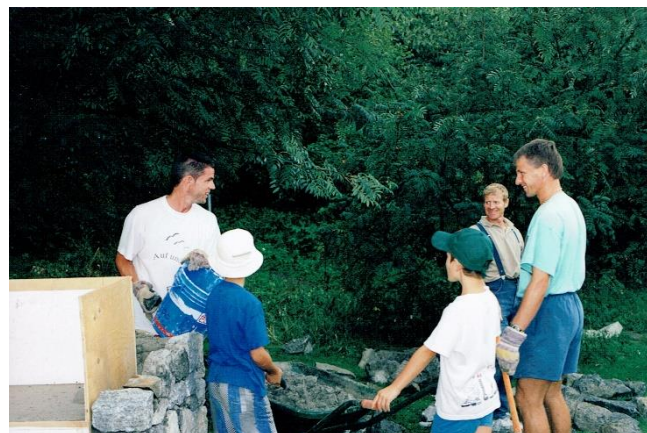
Der Grill bei der Tennishütte wird gebaut 2000