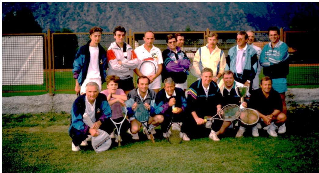
Ausflug Würselen 1991