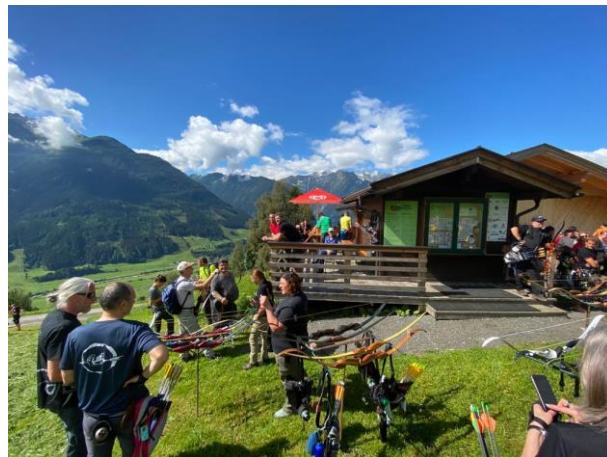
Sommerturnier am 18. Juli Riarco Ritten (1. und 3. Platz)