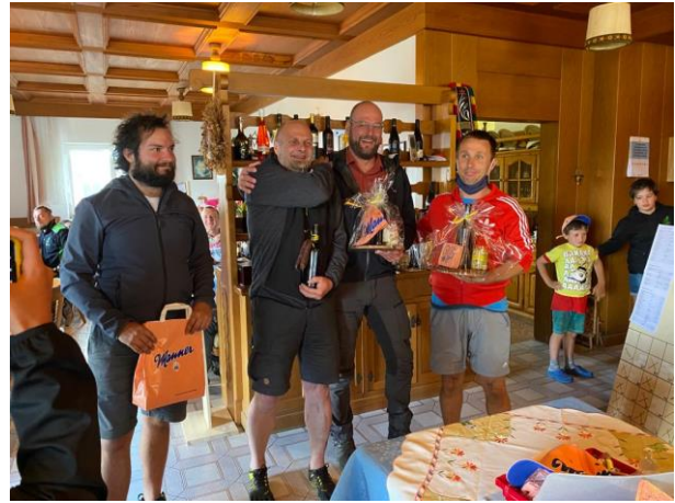
Turnier am 25. und 26. Juli Greentarget Arlberg (1. und 4. Platz)