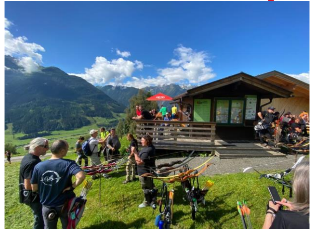
Sommerturnier am 18. Juli Riarno Ritten (1. und 3. Platz)